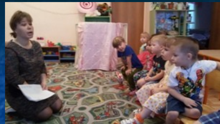
Лица Разумовская «Повар»