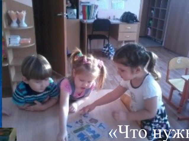
«Что нужно для работы?»