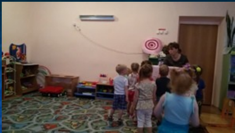
Загадки про овощи