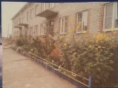
Муниципальное казённое дошкольное образовательное учреждение - детский сад № 6 (Филиал №2)