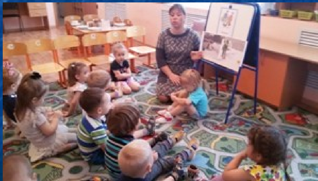
Лица Разумовская «Дворник»